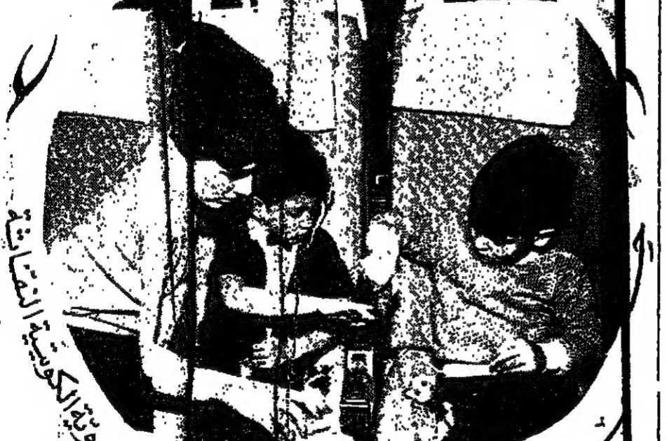
لاطفة الكرام استعدوا الاوقات